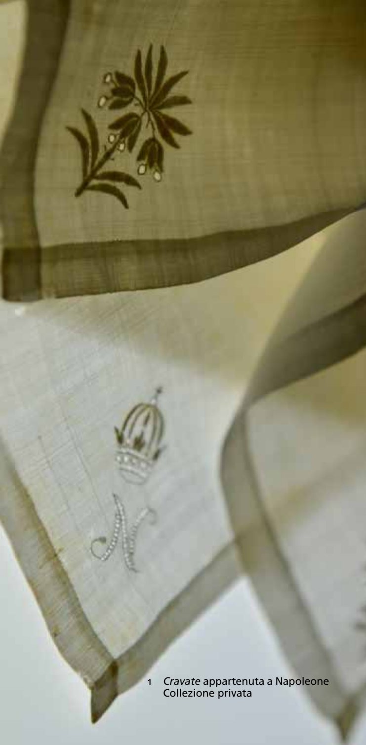
1 Cravate appartenuta a Napoleone Collezione privata